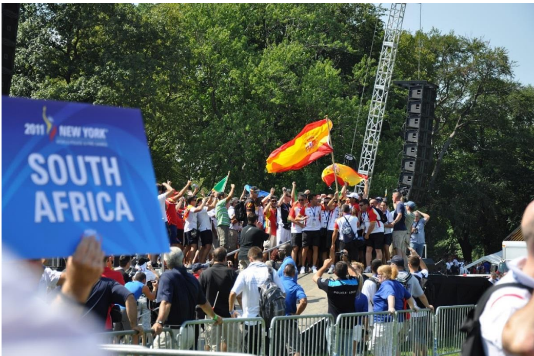
Desfiles de países en New York 2011.