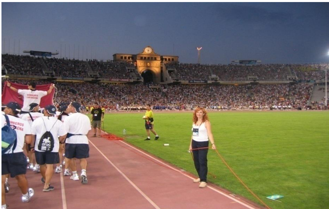
Desfile inaugural en WP&FG en Barcelona 2003.