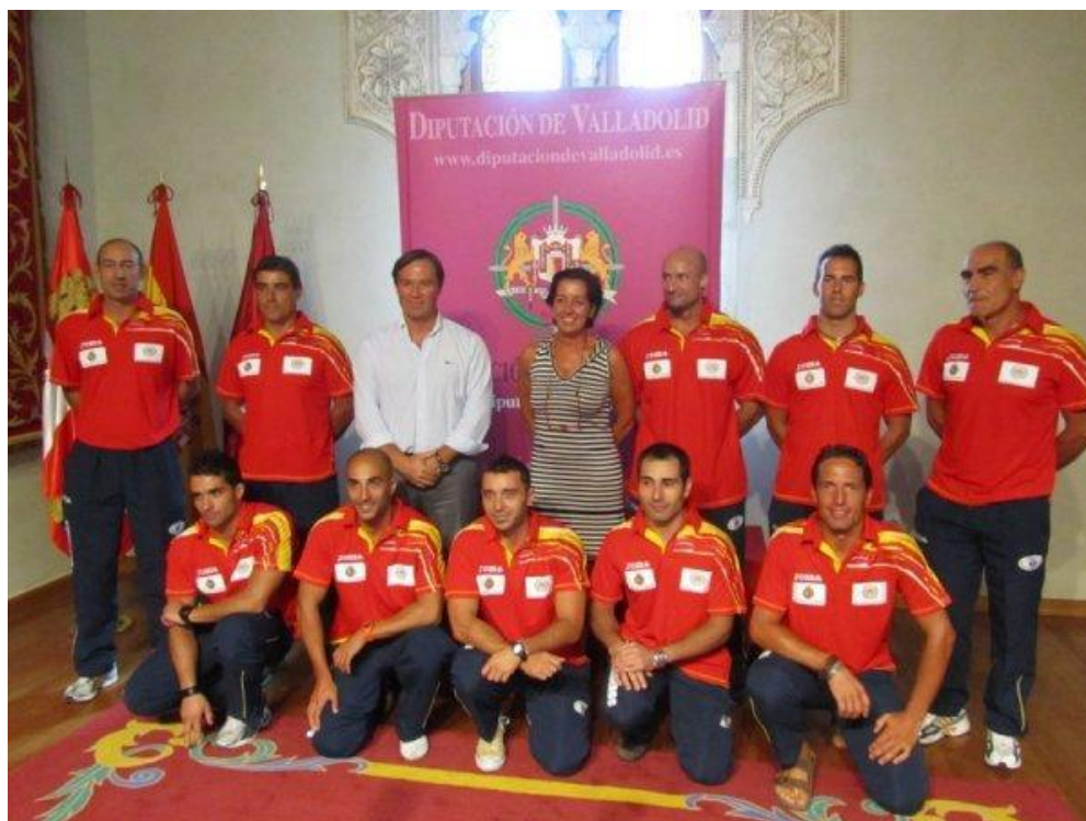
Presentación en julio de 2011 en los salones de la sede de la Diputación