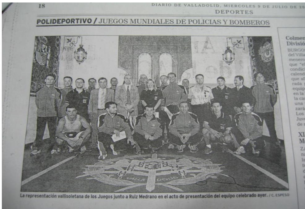
Recorte de la presentación en 2003 en los salones de la sede de la Diputación.