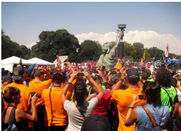
Desfile inaugural en New York

El descubrir para la mayoría, la grandeza del deporte en una dimensión internacional, que además les permitía intercambiar vivencias con compañeros de trabajo de todo el mundo, hizo que se plantearan seriamente por parte de algunos de ellos, la continuidad de lo que "habían descubierto".