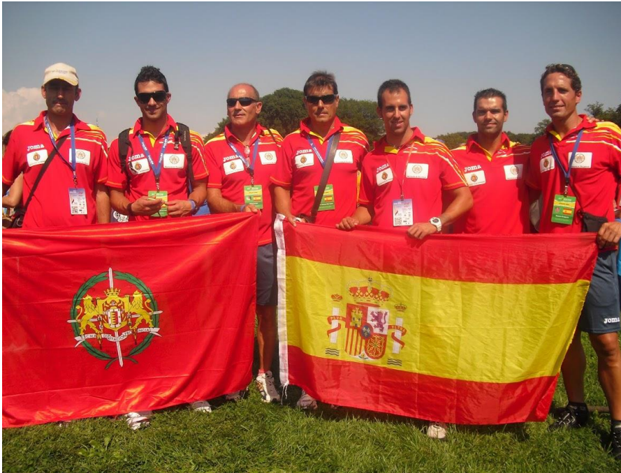
Los momentos antes del desfile inaugural en el parque, en New York 2011.