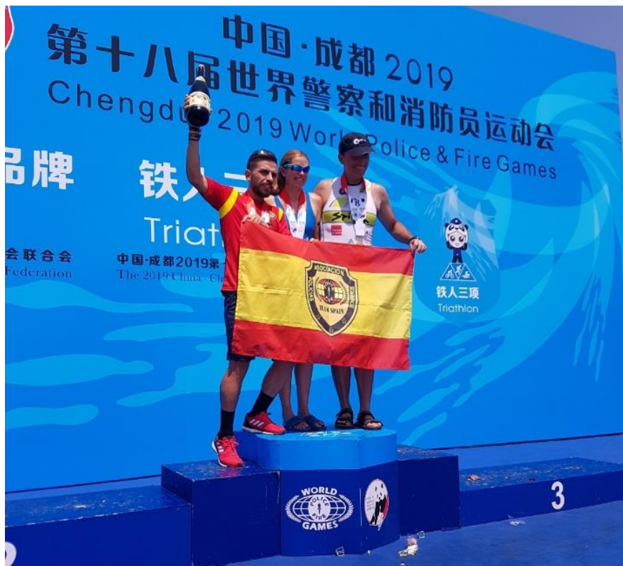
Chengdu 2019, China, últimos juegos celebrados.