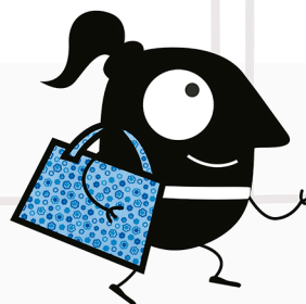
Sesión de meditación