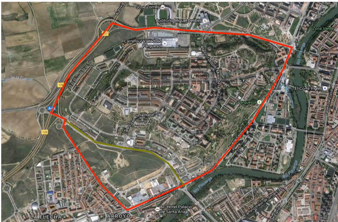
Ilustración 1. Vista satélite del barrio de Parquesol, con sus límites.

Las vías de acceso a Parquesol son la Avenida de Salamanca, al este, la avenida del Monasterio de Nuestra Señora de Prado, al norte, la calle Manuel Jiménez Alfaro, al sur, y la Autovía de Castilla A-62 al noroeste.