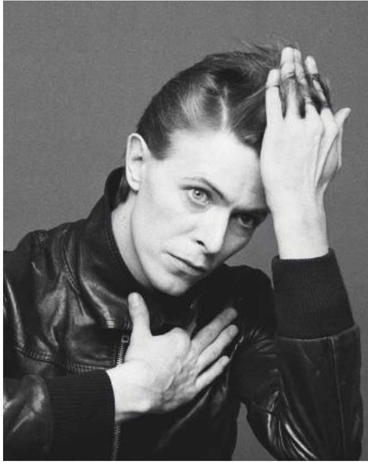
David Bowie, The Next Moment?, 1973

Esta exposición aúna la fotografía y la música, dos disciplinas que han vivido siempre en una simbiosis permanente, y que recoge las míticas y conocidísimas imágenes de 100 mitos de la Historia de la música rock a través de los fotógrafos más conocidos.