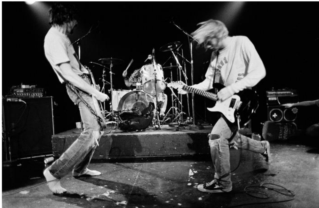
Nirvana, Commodore Ballroom, Vancouver, 1991