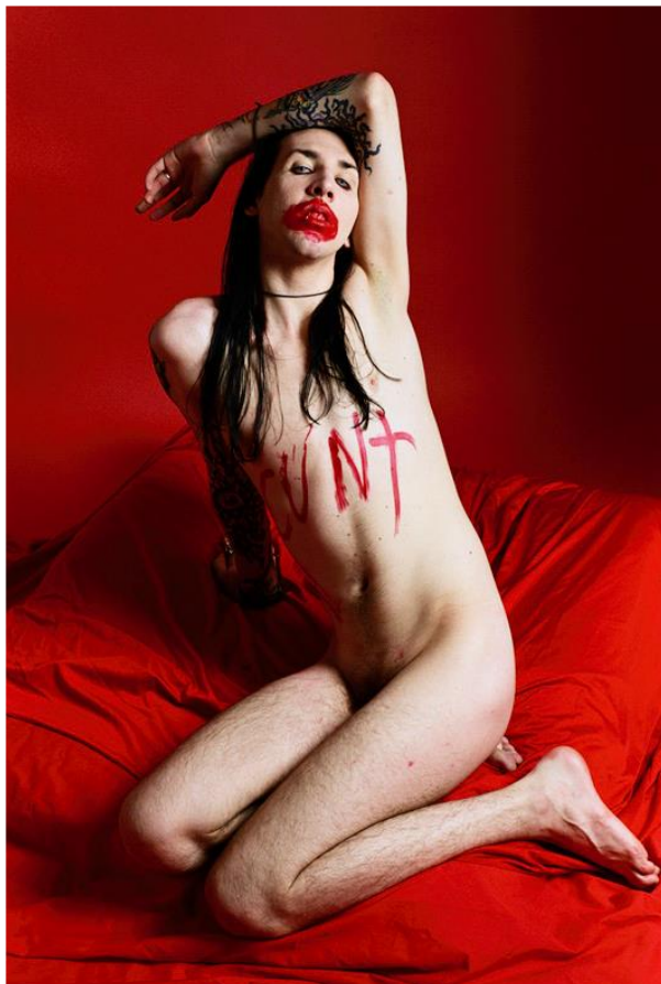
Marilyn Manson, 1994