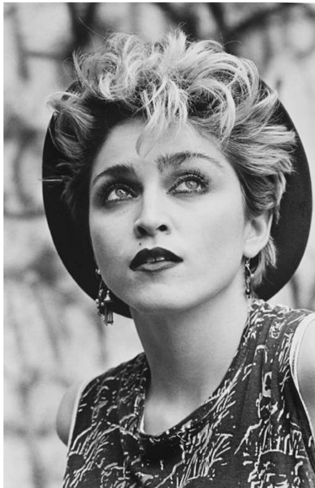
Madonna, NYC 1982