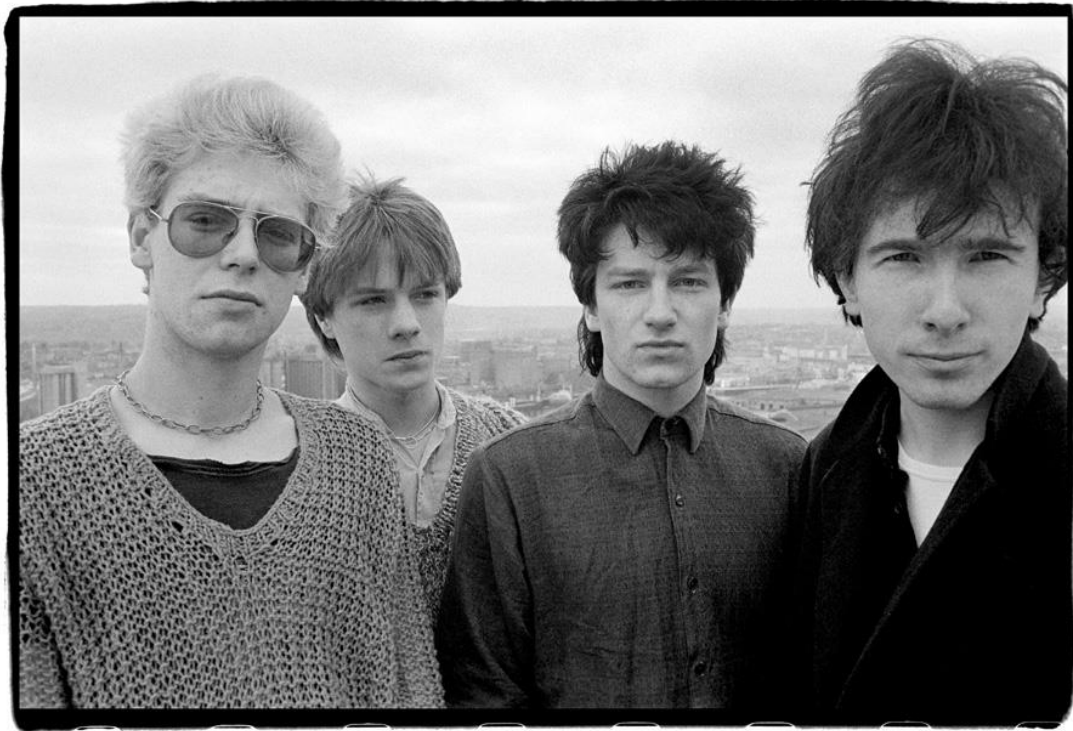
U2 en la terraza del Cork Country Club Hotel, Cork, República de Irlanda, 2 de marzo de 1980