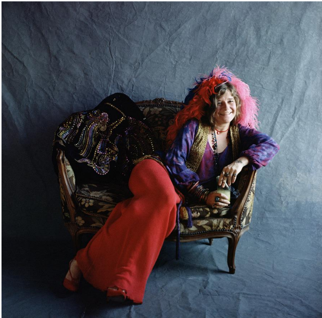
Janis Joplin, Hollywood, 1970. Fotografía de portada para el álbum 'Pearl'