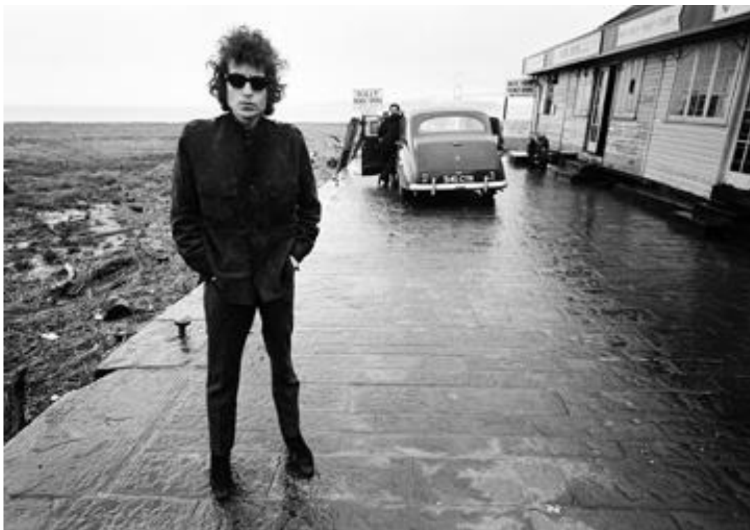
Bob Dylan, Aust Ferry, Bristol, England, 1966